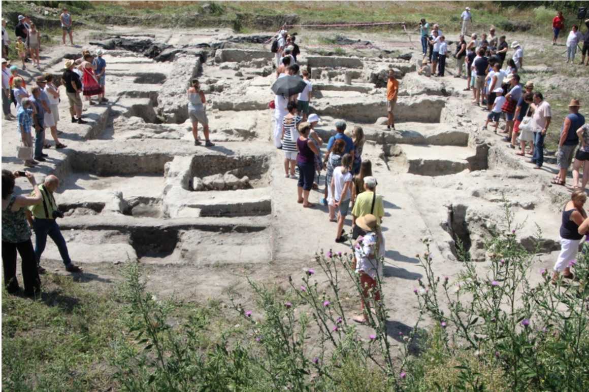
Nyílt nap a legiotáborban