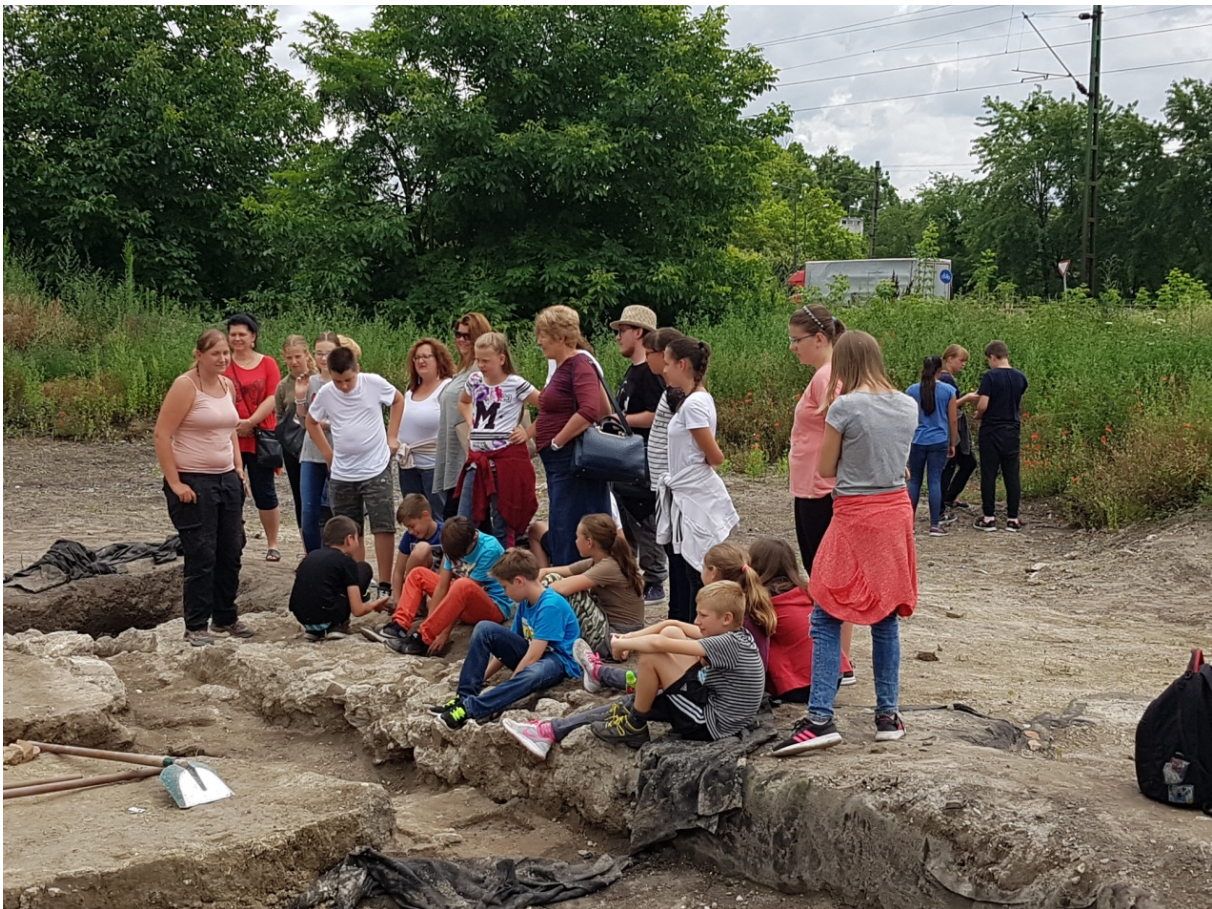
Azaumi nyári tábor látogatói